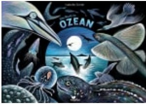
Eine Nacht im Ozean